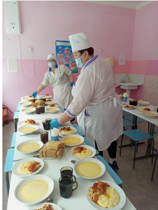
Личная гигиена сотрудников