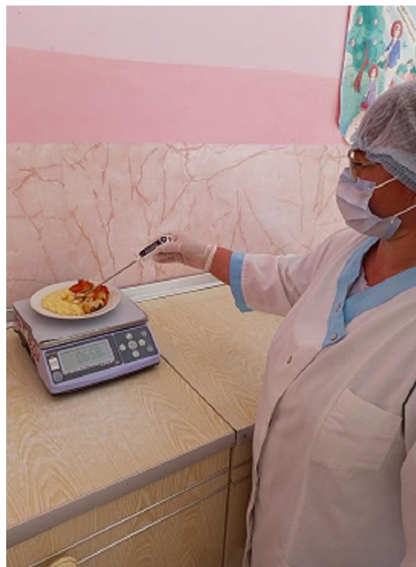
Контроль соответствия меню приготовленным блюдам, температуры и массы блюд