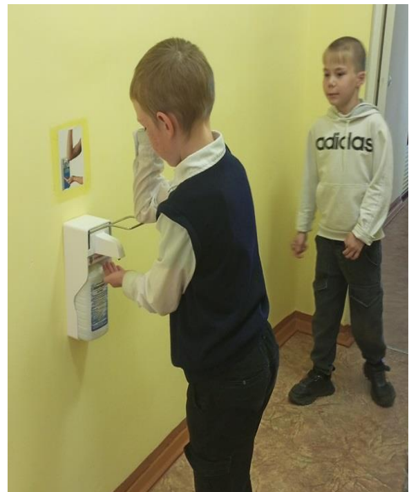
и личная гигиена учащихся