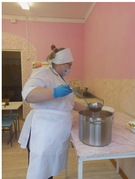
Личная гигиена повара