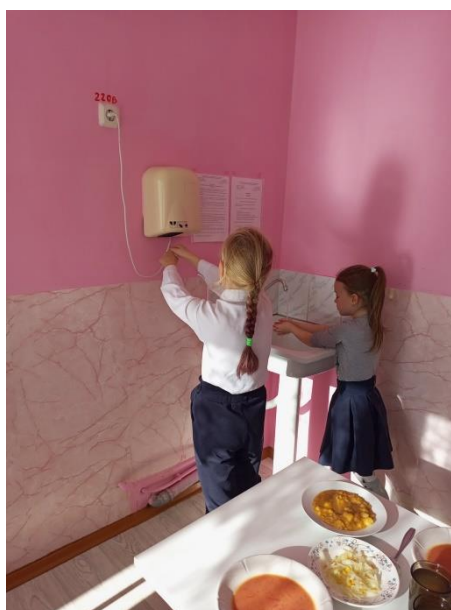
и личная гигиена учащихся