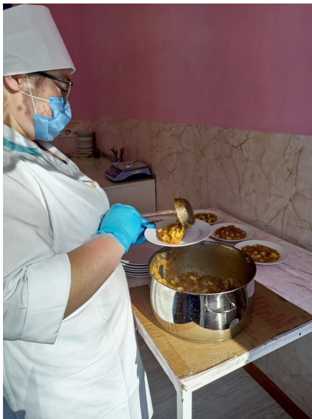
Личная гигиена повара