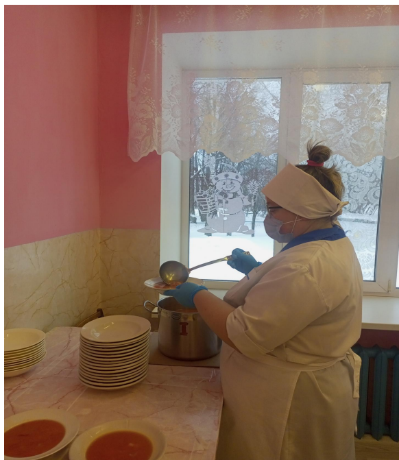
Личная гигиена повара