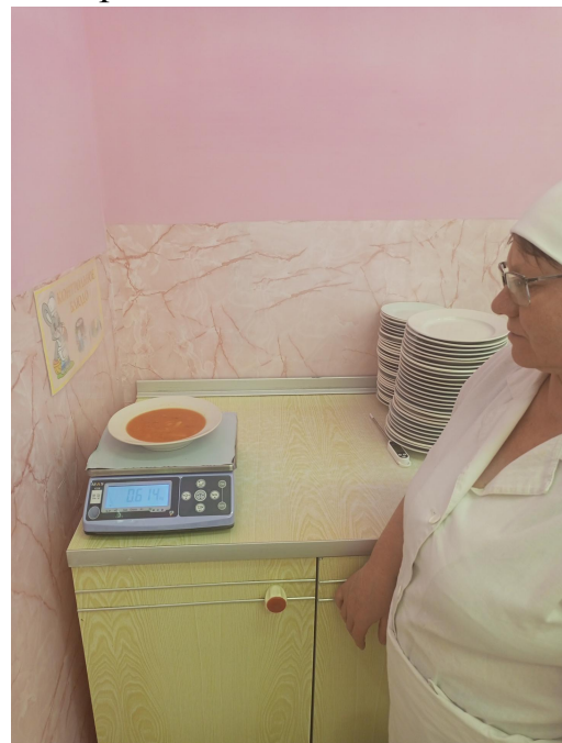
Контроль соответствия меню приготовленным блюдам, температуры и массы блюд