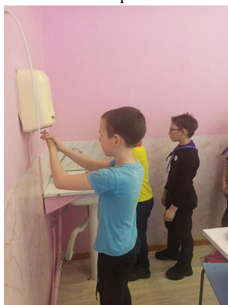
и личная гигиена учащихся