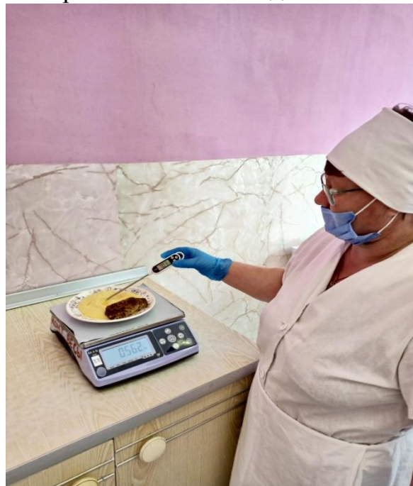
Контроль соответствия меню приготовленным блюдам, температуры и массы блюд