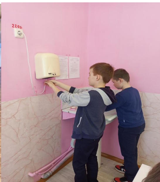
и личная гигиена учащихся