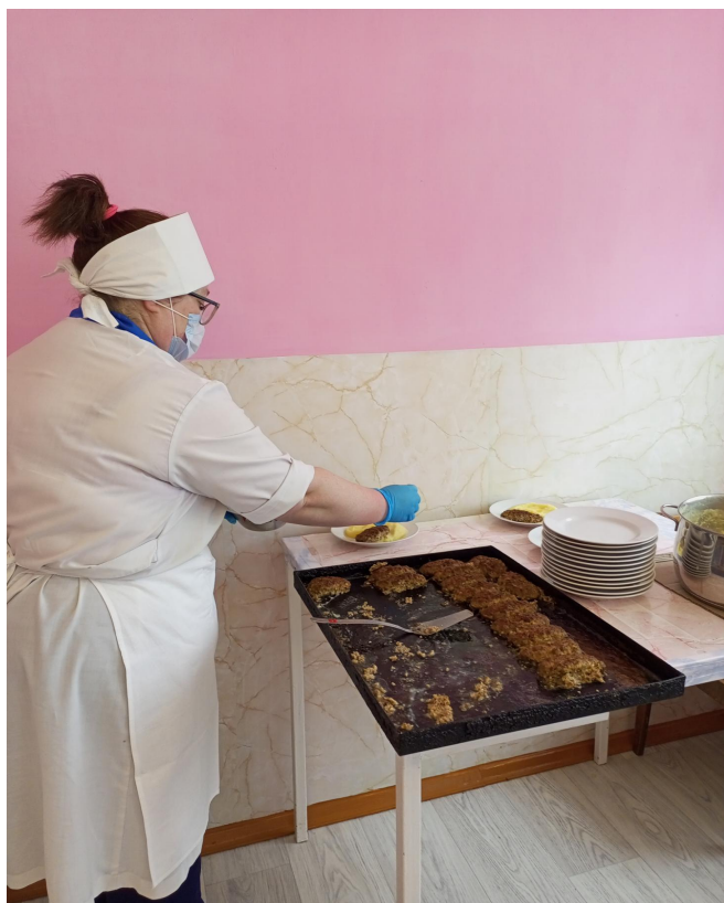
Личная гигиена повара