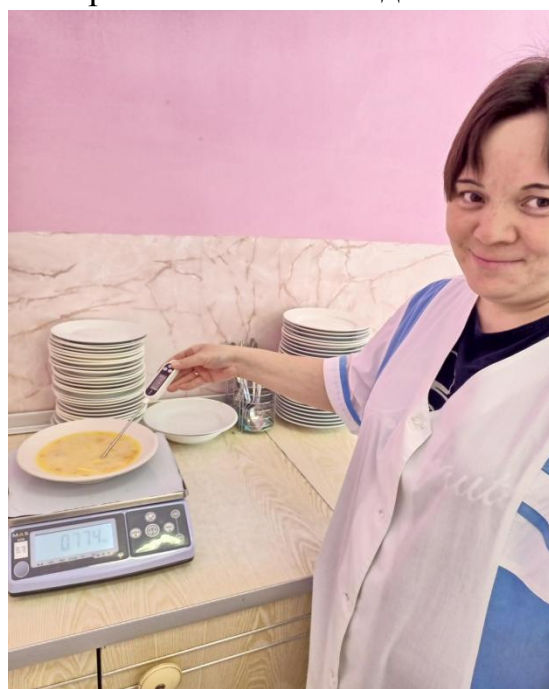
Контроль соответствия меню приготовленным блюдам, температуры и массы блюд