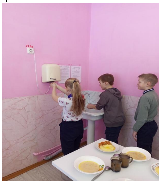
и личная гигиена учащихся