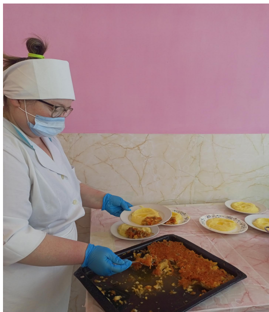
Личная гигиена повара